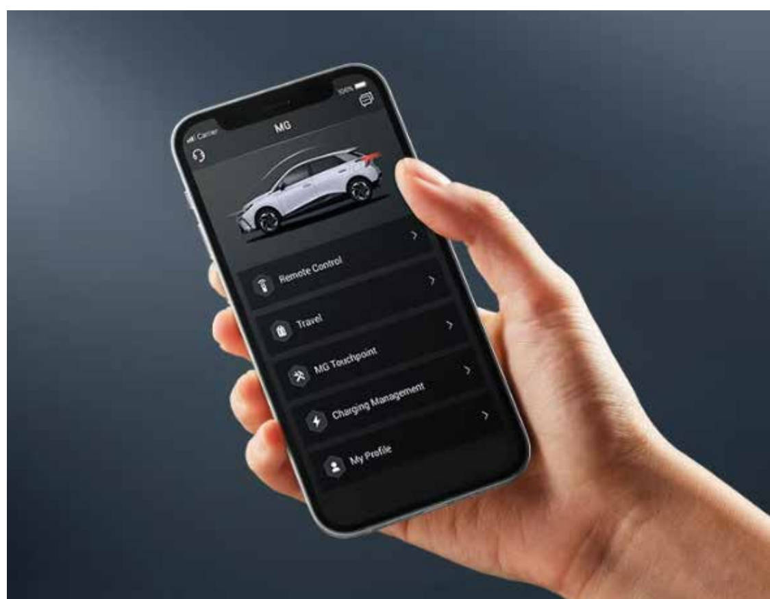
Aplicativo iSMART Controle remoto e chave digital)