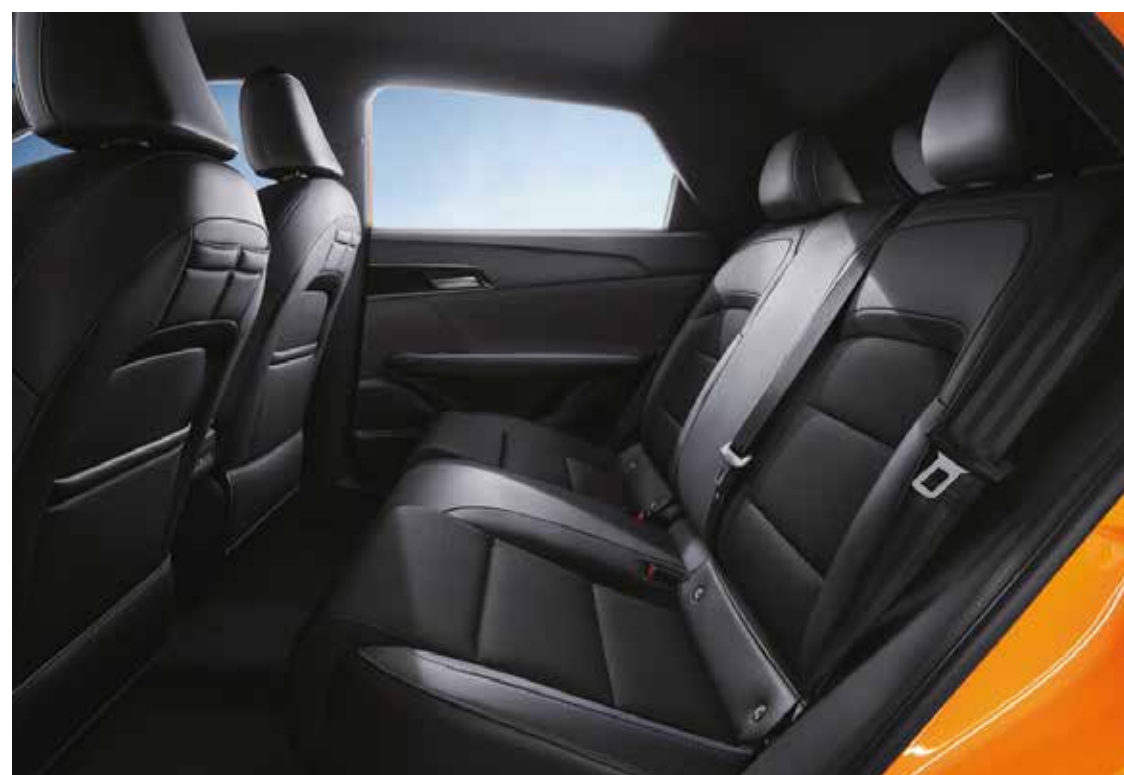
Espaço interior Bancos traseiros 60/40