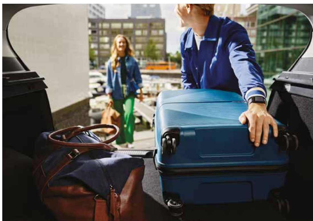
Porta-malas eficiente Capacidade : 350 - 1.165 litros