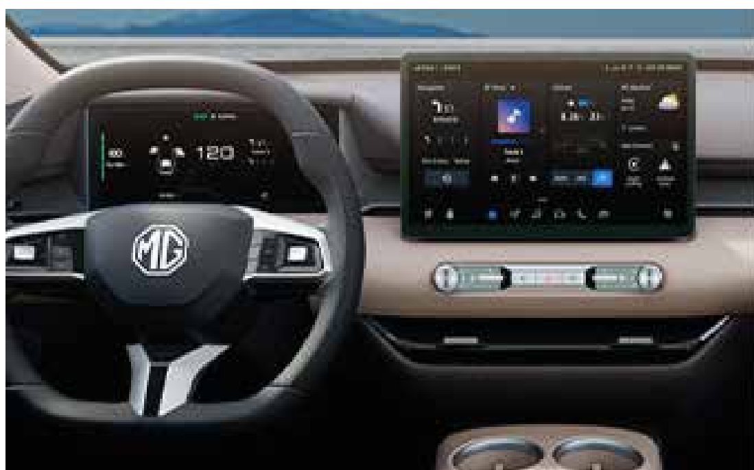
Painel de instrumentos de 10,25" Tela de entretenimento de 12,8"

Descubra um novo patamar de conforto e conveniência com um interior meticulosamente desenhado, que combina luxo, espaço e tecnologia intuitiva.